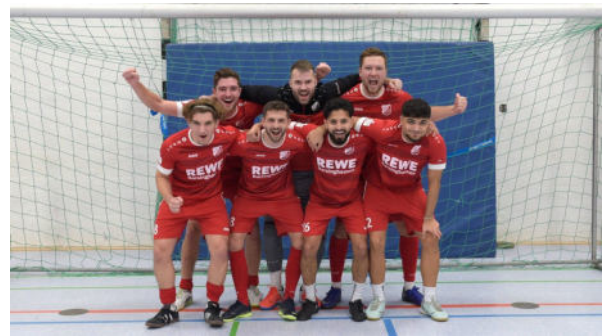
Sieger OST-Cup des TSV Berenbostel