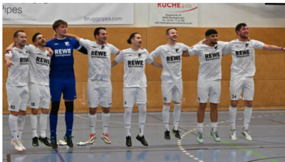
Turniersieg des BBB-Cups am 28.12.2024