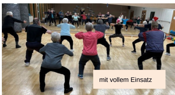
mit vollem Einsatz