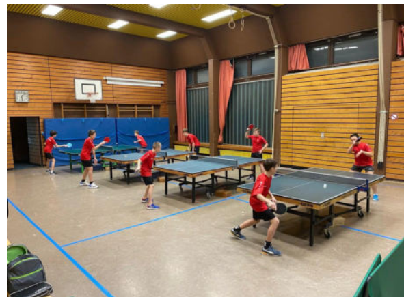
Training der TT-Jugend