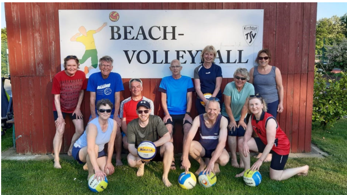
Beachmannschaft 1