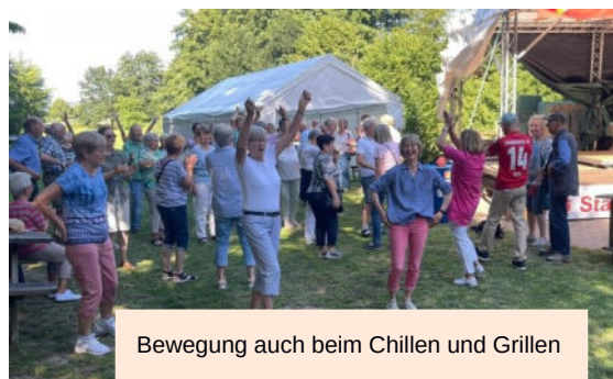
Bewegung auch beim Chillen und Grillen