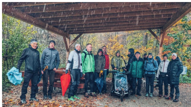
Wanderung statt MTB-Tour im Deister