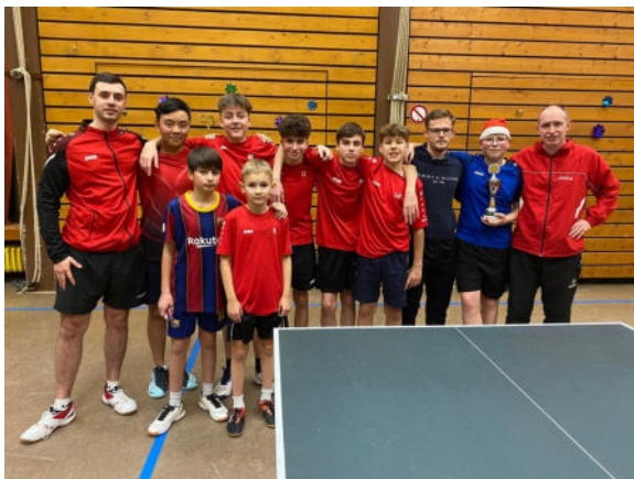
Vereinsmeisterschaft der TT-Jugend