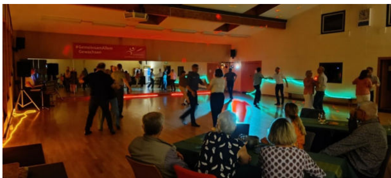
Tanz in den Mai 2024