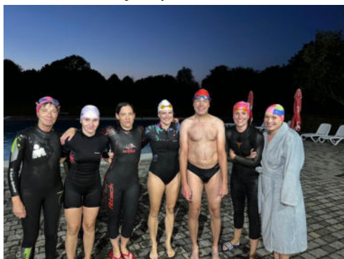
Training im Oktober